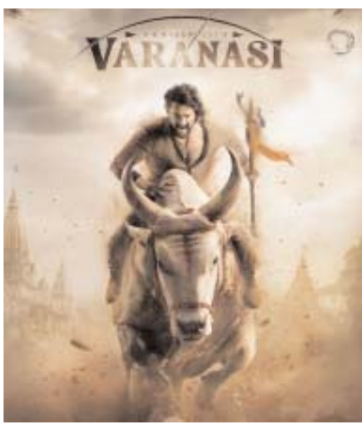
గుహల నేపథ్యంలోని కీలక సన్నివేశాలకు సంబంధించిన కొన్ని విజువల్స్ సోషల్ మీడియాలో దర్శనమివ్వడంతో అభిమానులు ఆశ్చర్యానికి గురయ్యారు. ఈ దృశ్యాలు సినిమా కథలో కీలక భాగంగా భావిస్తున్న నేపథ్యంలో వాటి లీక్ కావడం యూనిట్కు

టాలీవుడ్ సూపర్ స్టార్ మహేష్ బాబు, దర్శకధీరుడు ఎన్.ఎన్. రాజమౌళి కాంటినెంట్లో రూపొందించిన చిత్రం 'వారణాసి'పై దేశవ్యాప్తంగా భారీ అంచనాలు నెలకొన్నాయి. సినిమా ప్రకటించిన నాటి నుంచే ఈ ప్రాజెక్ట్పై అభిమానులు, సినీ పర్సనల్ ఆసక్తి పెరుగుతూనే ఉంది. ఇటీవల విడుదలైన డిజిటల్ ఈ చిత్రం ప్రేక్షకులను ఓ కొత్త ప్రపంచంలోకి తీసుకెళ్లడంతోనే సంతోషాలు మరింత బలపడ్డాయి. అయితే సినిమా షూటింగ్ ఎంత వేగంగా సాగుతోందో, అంతే వేగంగా లీకుల సమస్య కూడా చిత్రబృందాన్ని వెంటాడుతోంది. ముఖ్యంగా రాజమౌళి సినిమాల విషయంలో భద్రతా చర్యలు అత్యంత కట్టుదిట్టంగా ఉంటాయని పేరుంది. గతంలో ఆయన తెరకెక్కించిన చిత్రాల సమయంలో కూడా లీకులను అరికట్టేందుకు ప్రత్యేక చర్యలు తీసుకున్నారు. కానీ 'వారణాసి' విషయంలో మాత్రం పరుగుగా కొన్ని విజువల్స్ బయటకు రావడం చర్చనీయాంశంగా మారింది. కొద్ది నెలల క్రితం మహేష్ బాబు, పృథ్విరాజ్ సుకుమార్ పాల్గొన్న కీలక సన్నివేశానికి సంబంధించిన వీడియో క్లిప్ సోషల్ మీడియాలో వైరల్ అయిన సంగతి తెలిసిందే. ఆ సమయంలో చిత్రబృందంపై రాజమౌళి తీవ్ర ఆసంతుప్తి వ్యక్తం చేసినట్లు వార్తలు వచ్చాయి. భవిష్యత్తులో ఇలాంటి ఘటనలు పునరావృతమైతే కఠిన చర్యలు తప్పవని యూనిట్ సభ్యులను హెచ్చరించినట్లు ప్రచారం జరిగింది. ఆ తర్వాత కొంతకాలం పరిస్థితి సద్దుమణిగిస్తుందీ, తాజాగా మరోసారి లీకుల వ్యవహారం తెరపైకి వచ్చింది. ఇటీవల చిత్రీకరించిన ఊగ్రభక్తి