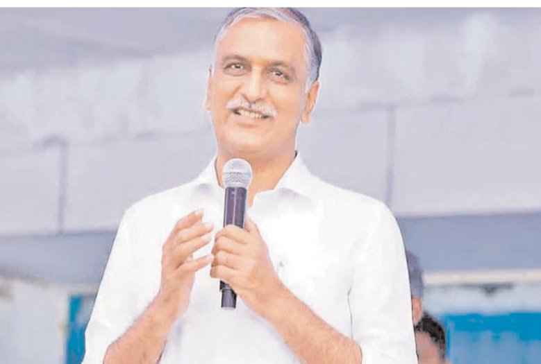
రాజకీయ దురుద్దేశంతోనే ఫార్మాసిటీ పక్కకు ఫార్మాసిటీ పూర్తిచేసి బీఆర్ఎస్ కు మంచి పేరు వస్తుందనే కుట్ర రాజకీయ ఉద్దేశంతోనే రేవంత్ సర్కార్ దీన్ని పక్కనెట్టిందని హాలీశ విమర్శించారు. ఘ్యాచర్ సిటీ పేరుతో భూ ములు పందిపెట్టి వెనుకదారిలో పెద్ద లబ్ధి పొందాలనే సెన్ వేశారు' అని ఆరోపించారు.

హైదరాబాద్, మే 22 : మజ్జీ బీఆర్ఎస్ ప్రభుత్వం వచ్చిన వెంటనే ఘ్యాచర్ సిటీని వందశాతం రద్దు చేస్తామని మాజీ మంత్రి హాలీశరావు స్పష్టంచేశారు. ఆ ప్రాంతంలో తిరిగి ఫార్మా సిటీనే పునరుద్ధరిస్తామని తేల్చిపెట్టారు. కేంద్ర పర్యావరణ శాఖ ఫార్మా సిటీకే అనుమతులు ఇచ్చింది అని గుర్తుచేశారు. నిబంధనల ప్రకారం.. ప్రాజెక్టులో 75 శాతం ఫార్మాసిటీ ఉండి, దానికి అనుబంధంగా కనీసం సౌకర్యాలైన ఎడ్యుకేషన్, హాస్పిటల్ వంటివి మిగతా 25 శాతంలో రావాలి. కానీ, కాంగ్రెస్ ప్రభుత్వం దీనిని పూర్తిగా తారుమారు చేస్తున్నది. 75 శాతం రియల్ ఎస్టేట్, ఇతర వ్యాపారాలు చేసి, కేవలం 25 శాతమే ఫార్మా రంగానికి పరిమితం చేయాలని చూస్తున్నది. ఇది చట్ట ప్రకారం ఎంతమాత్రం చెల్లదు. ప్రాజెక్టులో ఇలాంటి డీవియేషన్లు (నిబంధనల ఉల్లంఘనలు) ఉంటే, సేకరించిన రైతుల భూములను తిరిగి వారికే ఇప్పేయాలని పార్లమెంట్ చట్టం స్పష్టంగా చెప్తున్నది. ఇది నా మాట కాదు. చట్టం చెప్పన్న సత్యం అని ఉండబద్దటాకొట్టినట్లు చెప్పారు. ఆమెరికాలోని న్యూయార్క్ లో గురువారం ఎన్నారైల సమావేశంలో హాలీశరావు మాట్లాడుతూ.. ఇటీవల హైకోర్టులో ఒక కేసు విచారణ సందర్భంగా.. తాము ఫార్మా సిటీని కొనసాగిస్తున్నామని రేవంత్ ప్రభుత్వమే స్వయంగా కోర్టుకు ఆఫీడవిట్ సమర్పించిందని తెలిపారు.