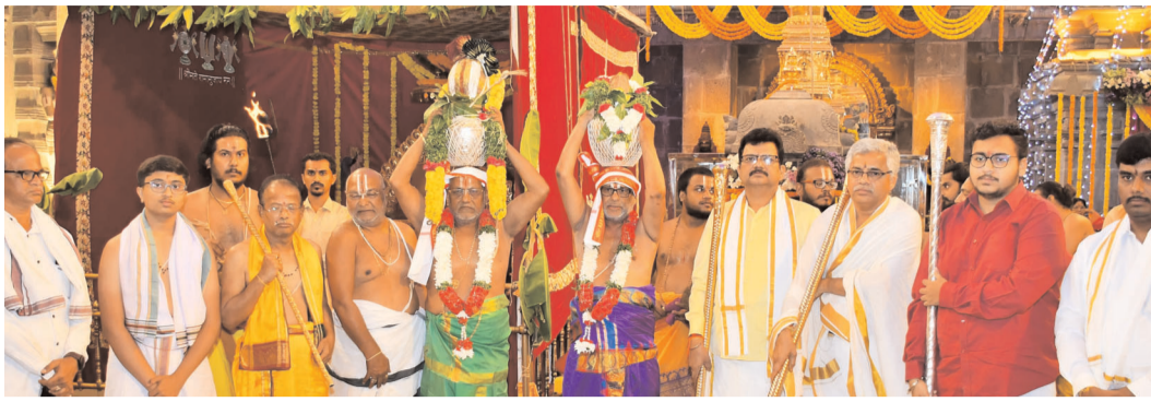
వీణాజ్ఞులను మన యాదాద్రి లీ లక్ష్మీ నరసింహ స్వామి వారికి తొలి తెలుగు వాగ్గేయకారులు పద కవితా పితామహులు శ్రీమన్ శ్రీ శ్రీ అన్నమాచార్యుల ద్వారా తరము శ్రీమాన్ శ్రీ శ్రీ శ్రీ తాళ్ల పాక అన్నమాచార్యుల వారి శిష్యులైన అన్నమయ్య నంకీరెడ్ల సాహిత్య ప్రచార క్రైడంగా నిర్వహించారు. గత రెండు సంవత్సరాల నుంచి యాదాద్రి వాసుని సన్నిధిలో స్వామి వారి స్వాతి