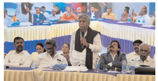
నిర్వహించాలని నిర్ణయించినట్లు వెల్లడించారు. దళిత క్రైస్తవులపై జరుగుతున్న దాడులను అరికట్టడంలో ఎంఆర్పీఎస్ ముందుండి పోరాటం చేస్తుందని స్పష్టం చేశారు. 1950 రాష్ట్రపతి ఉత్తర్వులను రద్దు చేయాలని, లేకపోతే సిక్కు, బౌద్ధ దళితులకు కల్పించిన మినహాయింపులను దళిత క్రైస్తవులకు కూడా వర్తింపజేయాలని డిమాండ్ చేశారు. కేజీ బాలకృష్ణన్ కమిటీ నివేదికను కేంద్రానికి సమర్పించిన అనంతరం తదుపరి ఉద్యమ కార్యచరణను ప్రకటిస్తామని మందకృష్ణ మాదిగ వెల్లడించారు.

పోయిందని ఆరోపించారు. రంగనాథ్ మిశ్రా కమిటీ నివేదికపై కూడా సరైన నిర్ణయాలు తీసుకోలేదని అన్నారు. ప్రస్తుతం ఎన్డీఏ ప్రభుత్వం నియమించిన కేజీ బాలకృష్ణన్ కమిటీ ముందు దళిత క్రైస్తవుల ఆకాంక్షలను స్పష్టంగా ఉంచాలని, అందుకోసం అన్ని సంఘాల ఏకమై సంయుక్త నివేదిక సిద్ధం చేయాలని పిలుపు నిచ్చారు. కుల వివక్షకు సంబంధించిన ఆధారాలను సమగ్రంగా సమర్పించాలని సూచించారు. సుప్రీం కోర్టు తీర్పుల నేపథ్యంలో దళిత క్రైస్తవుల్లో ఆందోళన నెలకొన్నప్పటికీ ప్రధాన రాజకీయ పార్టీలు స్పందించకపోవడం బాధాకరమన్నారు. ఈ పరిస్థితుల్లో ఎంఆర్పీఎస్ ముందుండి స్పందించి సమాజానికి ఆత్మస్థైర్యం కల్పించిందని తెలిపారు. దళిత క్రైస్తవుల్లో రాజకీయ చైతన్యం పెరగాల్సిన అవసరం ఉందని, పోరాటం మరియు రాజకీయ అవగాహన ప్రధాన అజెండాగా మారాలని ప్రజల భారతదేశ వ్యాప్తంగా ఉన్న దళిత క్రైస్తవులను ఏకం చేసి ఉద్యమాన్ని బలోపేతం చేయాలని పిలుపునిచ్చారు. కేజీ బాలకృష్ణన్ కమిటీకి నివేదిక సమర్పించే రోజున చర్చిలో ఒక గంట ప్రార్థన, అనంతరం రోడ్లపై ఒక గంట శాంతియుత నిరసన కార్యక్రమాలు