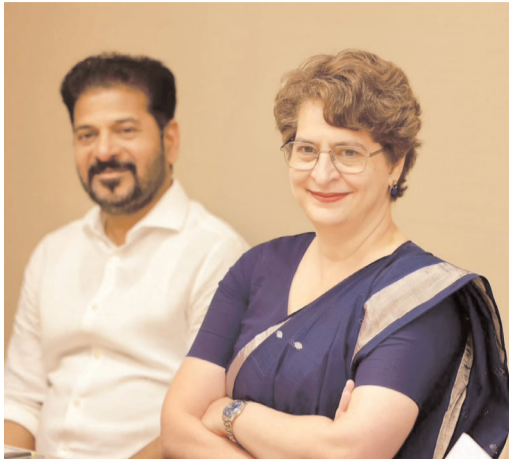
హైదరాబాద్లో జరిగిన సీడబ్ల్యూసీ సమావేశంలోనే మహిళా రిజర్వేషన్లపై స్పష్టతని ఇచ్చామని, కేంద్రాన్ని డిమాండ్ కూడా చేశామని ప్రస్తావించారు. వెస్ట్ బెంగాల్, తమిళనాడు సభ్యులు జరుగుతున్న వేక హత్యలకు మహిళా రిజర్వేషన్ల బిల్లు నివారణ, పునర్విభజన చట్టం సవరణ బిల్లులను తెరవైకి తీసుకువచ్చారని విమర్శించారు. అసెంబ్లీ ఎన్నికలు పూర్తయ్యాక అఖిలపక్ష సమావేశం పెళ్లాలని పార్లమెంటులో ప్రతిపక్ష పార్టీలన్ని కోరారుని గుర్తుచేశారు. కేంద్ర ప్రభుత్వం తమ ప్రయోజనాల కోసం ప్రయత్నం చేస్తుందిని మల్లికార్జున ఖర్గే పేర్కొన్నారు.

క్రింది అంశాలపై తన వాణిని వినిపించాలని నిర్ణయించింది. చట్టసభల్లో మహిళలకు 33 శాతం రిజర్వేషన్లు కల్పించే బిల్లుపై కాంగ్రెస్ పార్టీ స్పష్టమైన వైఖరిని ఖరారు చేయనుంది. ఓసీసీ మహిళలకు ఉప కోటా కల్పించాలనే డిమాండ్పై కూడా చర్చించారు. 2026 తర్వాత జరగనున్న నియోజకవర్గాల పునర్విభజన వల్ల దక్షిణాది రాష్ట్రాలకు జరిగే అన్యాయంపై సీఎంల రేవంత్ రెడ్డి, సిద్ధరామయ్య తమ వాదనలు వినిపించారు. అంతర్జాతీయంగా నెలకొన్న ఉద్రిక్తతలు, భారతదేశంపై వాటి ప్రభావం, భారత్ అనుసరిస్తున్న విదేశాంగ విధానంపై చర్చించారు. కేవలం మూడు రోజుల పాటు జరగనున్న పార్లమెంటు ప్రత్యేక సమావేశాల్లో కేంద్ర ప్రభుత్వం తీసుకురాబోయే బిల్లులను ఎలా అడ్డుకోవాలి లేదా చర్చలో ఎలా పైచేయి సాధించాలనే అంశంపై సభ్యులకు కాంగ్రెస్ అగ్రనేతలు దిశానిర్దేశం చేశారు. రాజీయే సార్వత్రిక ఎన్నికలను దృష్టిలో ఉంచుకుని సరేంద్రమోడి ప్రభుత్వం అనుసరించాల్సిన ప్రత్యేక సమావేశాలపై బిల్లులను ఎలా అడ్డుకోవాలి లేదా చర్చలో ఎలా పైచేయి సాధించాలనే అంశంపై సభ్యులకు కాంగ్రెస్ అగ్రనేతలు దిశానిర్దేశం చేశారు. రాజీయే సార్వత్రిక ఎన్నికలను దృష్టిలో ఉంచుకుని సరేంద్రమోడి ప్రభుత్వం అనుసరించాల్సిన ప్రత్యేక సమావేశాలపై బిల్లులను ఎలా అడ్డుకోవాలి లేదా చర్చలో ఎలా పైచేయి సాధించాలనే అంశంపై సభ్యులకు కాంగ్రెస్ అగ్రనేతలు దిశానిర్దేశం చేశారు.