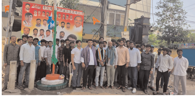
ఏ ఎం స్యూస్, కూకట్పల్లి :