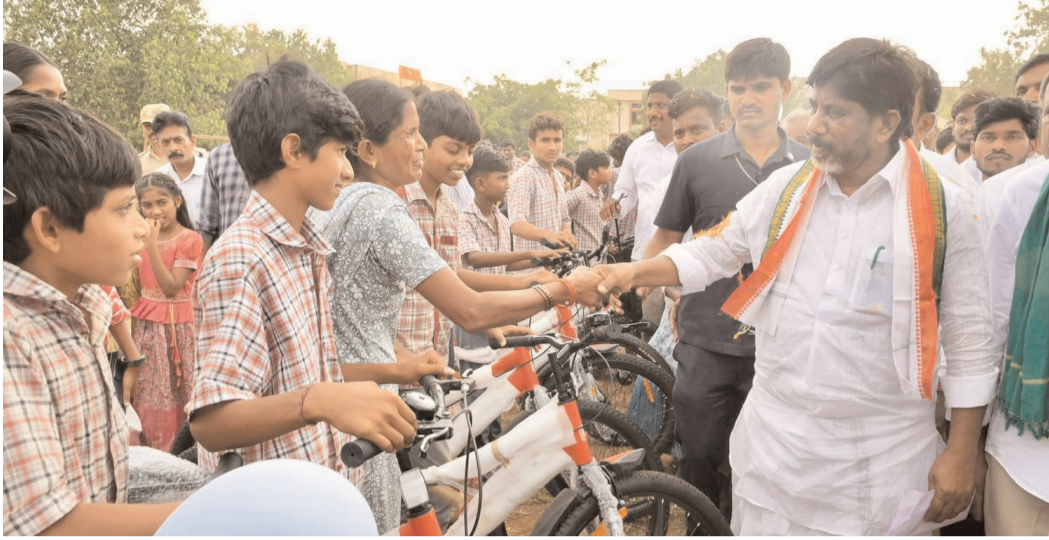
అందజేస్తున్నామని వివరించారు. బీఆర్ఎస్ హయాంలో సీతారామ ప్రాజెక్టును గాలికొదిలేశారని ఆరోపించారు. కాంగ్రెస్ అధికారంలోకి రాగానే సీతారామకు నిధులు కేటాయించి పనులు పూర్తి చేయమని స్పష్టం చేశారు. వ్యవసాయం, పరిశ్రమలు, విద్యపై ప్రత్యేక దృష్టి పెట్టామని అన్నారు. తెలంగాణ పబ్లిక్

కేసీఆర్ హయాంలోని పదేళ్లు వనరులు దోపిడీకి గురికావడం వల్ల తెలంగాణలో అభివృద్ధి జరగలేదని డిప్యూటీ సీఎం మల్లు భట్టి విక్రమార్కు వ్యాఖ్యానించారు. విద్య ద్వారానే తెలంగాణ రాష్ట్రంలో అభివృద్ధి జరుగుతుందని పేర్కొన్నారు. గురువారం ఎర్రపాలెంలో అమ్మ పౌండ్ పనుల అధ్యక్షులతో విద్యార్థులకు సైకిళ్లను పంపిణీ చేశారు. ఈ సందర్భంగా భట్టి విక్రమార్కు మాట్లాడారు. అక్షరమే ఆయుధంగా ప్రతి విద్యార్థి ఎదగాలని ఆకాంక్షించారు. జూన్ 2వ తేదీ నుంచి విద్యార్థులకు అల్పాహార పథకం అమల్లోకి తీసుకువస్తామని తెలిపారు. ఇంటర్ విద్యార్థులకు మధ్యాహ్నం భోజనం ఏర్పాటు చేస్తామని వివరించారు. ప్రతి బిడ్డకు ఉచితంగా మెరుగైన విద్య అందిస్తామని హామీ ఇచ్చారు. తెలంగాణలో 100 యంగ్ ఇండియా రెసిడెన్షియల్ స్కూల్స్ ఏర్పాటుకు శ్రీకారం చుడతామని భట్టి విక్రమార్కు పేర్కొన్నారు. మధిర నియోజకవర్గ రెండు గ్రామాల్లో ఆరుకునేందుకు ప్రణాళిక బద్ధంగా కృషి చేస్తున్నామని డిప్యూటీ సీఎం భట్టి విక్రమార్కు తెలిపారు. రైతులు ఆర్థికంగా నిలదొక్కుకోవాలన్న తమ ప్రభుత్వ లక్ష్యమని పేర్కొన్నారు. ఎన్నోనే ఆరుకట్ట పందిలో చివరి భూములకు సాగునీరు అందించాలన్నదే తన సంకల్పమని తెలిపారు. రూ.36 కోట్లతో కట్టలేరు కాలువల మరమ్మత్తులను పట్టామని అన్నారు. ఎన్నోనే కెనాల్ మూడవ జోన్ పరిధిలో ఉన్న భూములను రెండవ జోన్ కిందకు తీసుకువచ్చి లిఫ్ట్ ఇరిగేషన్ ద్వారా సాగునీరు