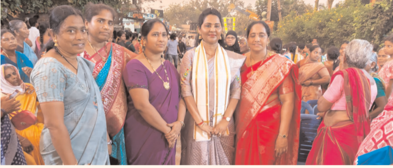
ఏ ఎం స్యూస్, విజయవాడ :