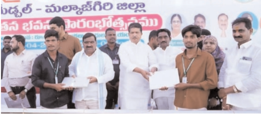
ట్యాప్ లు అంగన్వాడీ తీవ్రదకు సెల్ ఫోన్లు అందజేశారు. ఈ కార్యక్రమంలో నియోజకవర్గం కాంగ్రెస్ సీనియర్ నాయకులు, డివిజన్ మహిళా అధ్యక్షురాలు, యూత్ కాంగ్రెస్, ఎన్ ఎస్ యు బ నాయకులు, మైనారిటీ నాయకులు, ఎస్సీ సెల్ నాయకులు, టీసీ సెల్ నాయకులు, సేవ్ దళ్ నాయకులు కార్యక్రమం కాంగ్రెస్ పార్టీ అభిమానులు తదితరులు పాల్గొన్నారు.