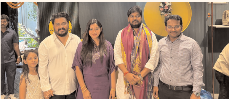
ఏ ఎం స్యూస్, జూబ్లీహిల్స్ :