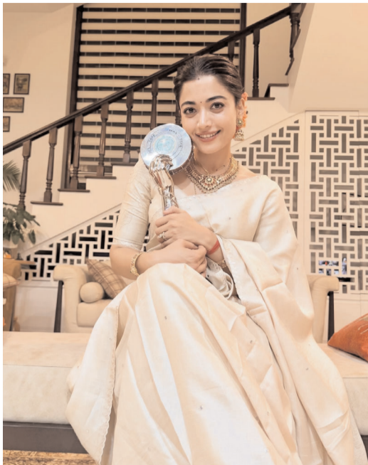
ఉత్తమ నటుడిగా నిలిచారు. హిందీలో రణవీర్ సింగ్ ఉత్తమ నటుడిగా, యామి గౌతమ్ ఉత్తమ నటిగా ఎంపికయ్యారు. ఈ అవార్డుల ప్రధానోత్సవ కార్యక్రమం ఏప్రిల్ 16న ముంబైలో జరగనుంది. ఈ వేడుకకు టాలీవుడ్ హీరో రానా దర్శనాది బాలీవుడ్