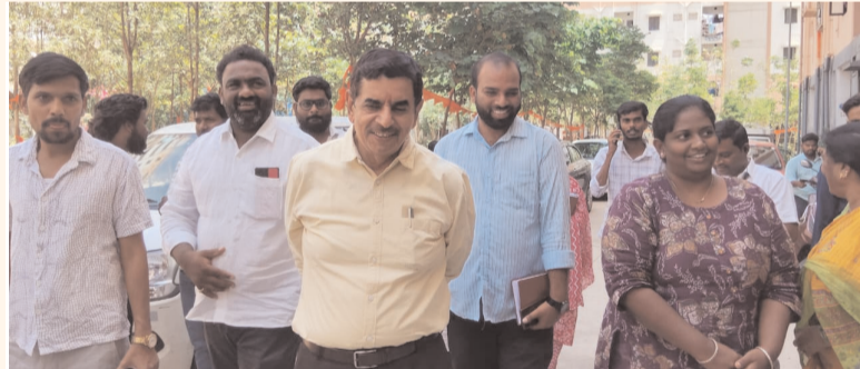
ఏ ఎం స్యూస్, పటాన్చెరు :