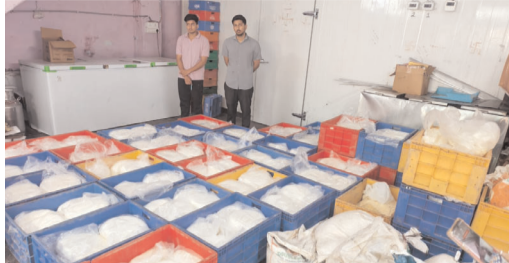
వట్ల పోలీసులు గుర్తించారు. పట్టుబడిన నిందితులను, స్వాధీనం చేసుకున్న సరుకును మహాకాణి పోలీస్ స్టేషన్లో అదుపులోకి తీసుకోవడానికి చర్యలు చేపట్టారు. ప్రజల ఆరోగ్యానికి హాని కలిగించే కల్తీ పాలను రుద్దు కఠిన చర్యలు తీసుకుంటామని పోలీసులు హెచ్చరించారు.

వాటిని నాణ్యమైనవిగా చూపిస్తూ కిలోల రూ.280 చొప్పున హోల్బట్ల, క్యాటరంగ్ సర్వీసులు, సాధారణ ప్రజలకు విక్రయంపై పట్టు తెలింది. ఈ ఉత్పత్తులను ప్యాసిక్ కవర్లలో అపరిశుభ్ర వాతావరణంలో నిల్వ చేసి, ఎటువంటి ట్రాండ్ పేరు, తయారీ తేదీ, గడువు తేదీ లేకుండా విక్రయంపై పట్టు అధికారులు గుర్తించారు. దాడిలో పోలీసులు మొత్తం 3,892 కేజీల కల్తీ పాల ఉత్పత్తులు స్వాధీనం చేసుకున్నారు. వీటి విలువ సుమారు రూ. 11,11,600/-గా అంచనా. స్వాధీనం చేసుకున్న వాటిలో 2,572 కేజీల పనిర్, 927 కేజీల కోవా, 249 కేజీల వైట్ క్రీమ్, 132 కేజీల ఆజ్యో కలకండ్, 12 కేజీల నెయ్యి ఉన్నాయి. ఈ అక్రమ వ్యాపారంలో శంకర్లాల్ మిల్స్ ప్రొడక్ట్స్, విజయ మిల్స్ పావ్, వైభవ్ మిల్స్ డెయిరీ, శ్రీ బాలాజీ డెయిరీ ప్రొడక్ట్స్, జగదాంబ మిల్స్ మర్చండ్, తలసి గిరిరాజ్ డెయిరీ ప్రొడక్ట్స్ సంస్థలు పాల్గొ