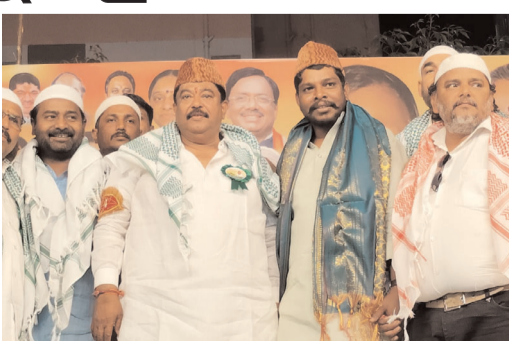
కార్యక్రమంలో మైనారిటీ నాయకులు యువకులు, మహిళలు అధిక సంఖ్యలో పాల్గొని ఈ కార్యక్రమాన్ని విజయవంతం చేశారు.