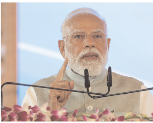
నిరసనలు తెలపడం రాజకీయంగా తీవ్ర దుమారం రేపిన సంగతి తెలిసిందే. ఈ విషయాన్ని ప్రస్తావిస్తూ, మొత్తం దేశం ఈ చర్యను ఖండించిందన్నారు. ఓటమితో నిరాశ చెందిన కాంగ్రెస్ దేశం పైనే దాడికి దిగిందన్నారు. నిరాశతో దుస్తులు చింపుకోవడం తప్ప.. వాళ్లకి మరేమీ మిగలేదని ఎద్దేవా చేశారు.

ప్రయోజనాల పరిరక్షణలో కాంగ్రెస్ మరోసారి విఫలమైందని విమర్శించారు. దేశంలో భయాందోళనలు సృష్టించేందుకు ప్రయత్నిస్తోంది. మోడీని రూపొందించడమే పనిగా పెట్టుకుంది. అంతర్జాతీయంగా భారత్ శీఘ్ర అభివృద్ధిని సాధించడం కొన్ని శక్తులకు ఇష్టంలేదు. అలాంటి శక్తుల చేతిలో కాంగ్రెస్ కీలుబొమ్మగా మారేందుకు మోడీ తీవ్ర స్థాయిలో విమర్శలు గుప్పించారు. కాంగ్రెస్ పార్టీకి అసాధారణ గురించి కానీ, దేశం గురించి కానీ ఎలాంటి విజన్ లేదని మోడీ తప్పుపట్టారు. మోడీని రూపొందించడం, అభివృద్ధి, వదంతుల ప్రచారంతో ప్రజలను తప్పుదారి పట్టించడమే ఆ పార్టీకి తెలుసునని అన్నారు. బీజేపీ ప్రభుత్వం యువతకు అనేక అవకాశాలు కల్పించింది పేర్కొన్నారు. కాంగ్రెస్ అలోచనలు ఎక్కడ ఆగిపోయాయో, అక్కడి నుంచే తమ పని ప్రారంభమవుతుందని, అభివృద్ధిలో వెనుకబడిన వారికి ప్రాధాన్యత ఇవ్వడమే బీజేపీ ప్రధాన మంత్రిమని చెప్పారు. మీరు కాంగ్రెస్ ను ఇక్కడినుంచి ఎప్పుడో తరిమికొట్టారని వ్యాఖ్యానించారు. రానున్న ఎన్నికల్లోనూ దీని రాష్ట్రం ఆ పార్టీకి గుణపాఠం చెప్పనుందన్నారు. ఇటీవల ఢిల్లీలో జరిగిన ఏల ఇంపాక్ట్ సమితిలో యాత్ కాంగ్రెస్ నేతలు చొక్కాలు విప్ప