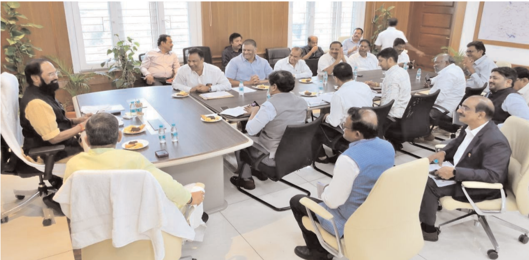
సంస్థలకు కమర్షియల్ సిలిండర్ల విషయంలో ప్రాధాన్యత ఇస్తున్నాం. సివిల్ సప్లై భవన్ లో కమాండ్ కంట్రోల్ రూమ్ ఏర్పాటు చేశామని. ఎవరైనా కృత్రిమంగా గ్యాస్ కొరత సృష్టించినా.. ఖాళీ మార్కెట్ చేసినా హెల్ప్ లైన్ 180042500344 కు కాల్ చేయొచ్చు' మంత్రి ఉత్తమ్ చెప్పారు. రాష్ట్రవ్యాప్తంగా 1.3 కోట్ల మంది యాక్టివ్ గృహ వినియోగదారులు ఉన్నారు, వారికి సరిపడా సిలిండర్ల అందోళన కంపెనీలు అందిస్తున్నాయని మంత్రి తెలిపారు. గతంలో రోజుకు సగటున 2.15 లక్షల సిలిండర్లు సరఫరా అయ్యేవని, ప్రస్తుతం డిమాండ్ ను బట్టి దానిని 2.3 లక్షలకు పెంచినట్లు ఆయన వివరించారు. గ్యాస్ కొరత ఉండన్న అందోళనతో వినియోగదారులు అనవసరంగా ఓవర్ బుకింగ్ చేసి సిస్టమ్ ను ఓవర్ బుకింగ్ చేయవద్దని ఆయన విజ్ఞప్తి చేశారు. హోటళ్లు, ఇతర వ్యాపార సంస్థలు వాడే 19 కేజీల కమర్షియల్ సిలిండర్ల

సరఫరాలో మాత్రం తగ్గదల ఉన్న మాట వాస్తవమేనని మంత్రి అంగీకరించారు. కేంద్ర ప్రభుత్వం నిర్దేశించిన కొత్త మార్గదర్శకాల వల్ల గతంలో ఉన్న సరఫరాలో కేవలం 20 శాతం మాత్రమే ప్రస్తుతం అందుబాటులో ఉందని ఆయన వివరించారు. గతంలో రోజుకు 23,000 కమర్షియల్ సిలిండర్లు సరఫరా అయ్యే చోట, ఇప్పుడు కేవలం 6,200 మాత్రమే వస్తున్నాయని, ఈ సమస్యను పరిష్కరించేందుకు కేంద్ర ప్రభుత్వంతో చర్చలు జరుపుతామని ఆయన హామీ ఇచ్చారు. రాష్ట్రంలో గ్యాస్ పంపిణీ సక్రమంగా జరిగేలా చూడటంలో పాలు, అక్రమ నిల్వలను అరికట్టేందుకు రాష్ట్ర, జిల్లా స్థాయి కమిటీలను ఏర్పాటు చేసినట్లు మంత్రి తెలిపారు. గృహ అవసరాల సిలిండర్ల పక్కనూ పట్టణాలకు కఠిన చర్యలు తీసుకుంటామని ఆయన హెచ్చరించారు. మొత్తానికి, సామాన్య డిమాండ్ మంట అరిపోకుండా ప్రభుత్వం అన్ని జాగ్రత్తలు తీసుకుంటోందని ఆయన భరోసా ఇచ్చారు.